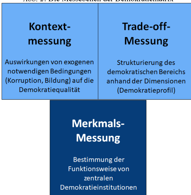
Abb. 2: Die Messebenen der Demokratiematrix

Zudem bietet die Demokratiematrix drei verschiedene Messebenen an, die unterschiedliche Perspektiven auf die Demokratiequalität eines Landes bieten: die reine Merkmalsmessung, die Kontextmessung sowie die Trade-off-Messung. Die Merkmalsmessung befasst sich nur mit der Funktionsweise zentraler demokratischer Institutionen und stellt die Ausgangsmessung dar. Die Kontextmessung geht über diese Merkmale hinaus und betrachtet die Einbettung dieser demokratischen Institutionen in sozio-kulturelle Kontexte, welche die Wirkungsweise dieser Institutionen unterminieren. So führt Korruption in der Exekutive und Legislative nicht nur zu einer Verfälschung der Entscheidungsprozesse sondern auch zu Verzerrungen bei der Umsetzung von Gesetzen und Recht. Schließlich werden demokratische Zielkonflikte mit Hilfe der Trade-off-Messung aufgegriffen. Die Dimensionen Freiheit, Gleichheit sowie Kontrolle lassen sich nicht im Sinne einer perfekten Demokratie alle gleichzeitig maximieren, sondern demokratische Systeme stehen vor der Entscheidung, welcher dieser Dimensionen sie zu Lasten anderer Dimensionen bevorzugen möchten. So lassen sich libertäre, egalitäre sowie kontrollfokussierte Demokratien differenzieren.